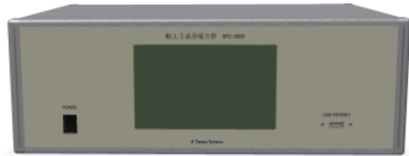
回路部及びデータロガー